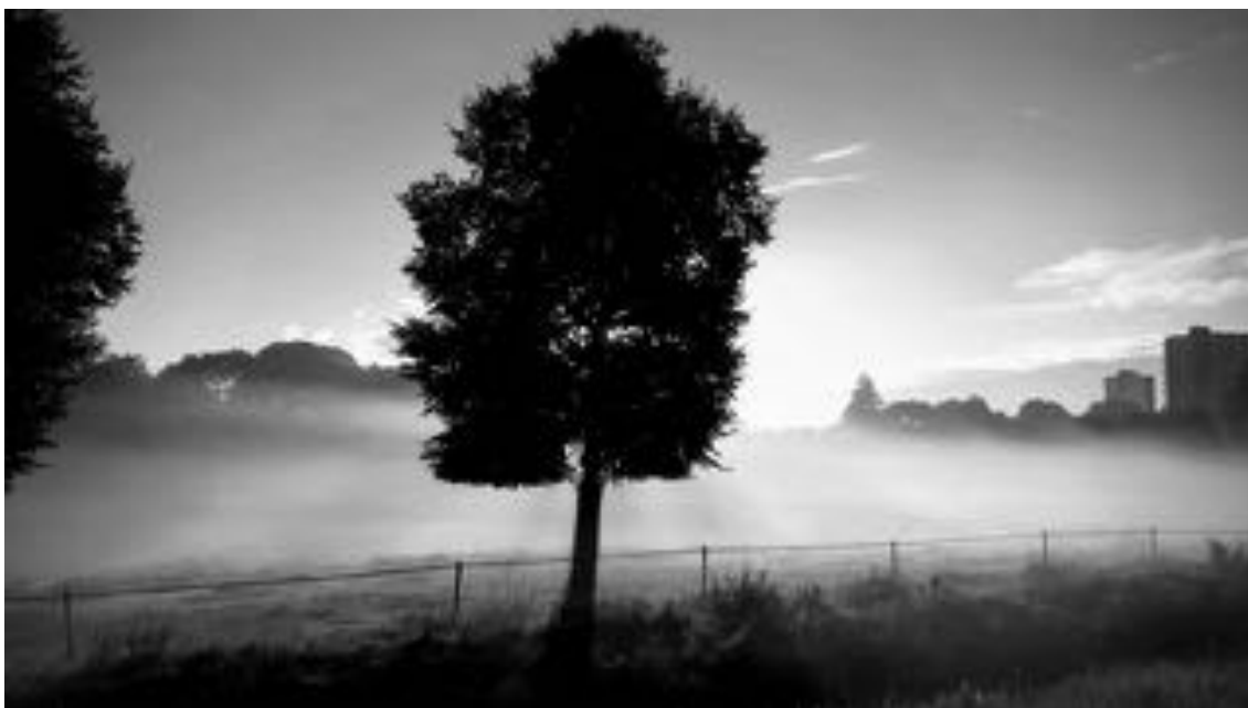
Foto: onze buurt vanaf het Kikkerpad