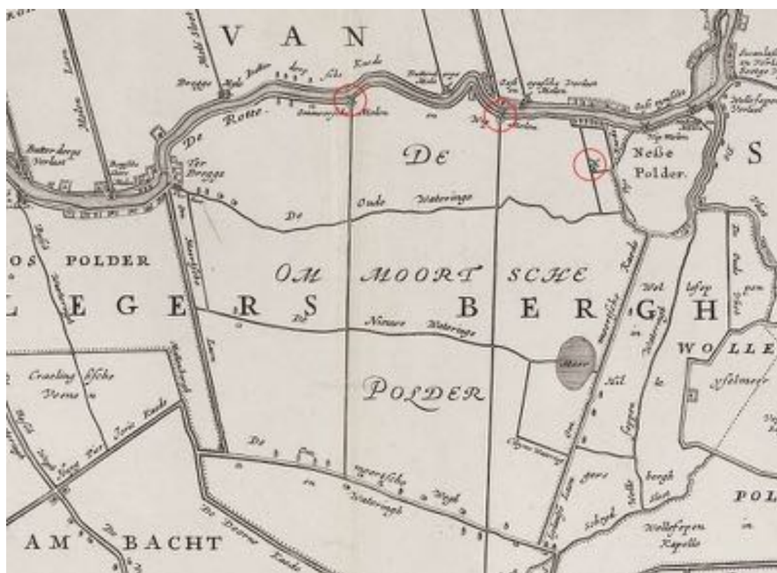
Datering 1660-1680: Links bovenaan aan de Rotte: 'Ter Bregge', rechts daarvan: de Ommoortsche Molen, midden: de Wip Molen, rechts de Nese polder. Onderaan de kaart de 'Ommoortsche weg' die liep ter hoogte van de huidige Hoofdweg.

Vanaf omstreeks 1530 werd de baggerbeugel hiervoor gebruikt. Deze bestaat uit een meterslange, soms wel 5 meter, houten steel met daaraan een ijzeren ring met een net. Daarmee kon de bagger vanaf grotere diepte omhooggetrokken worden. Er ontstonden grote, diepere, met water gevulde gaten. Om droge voeten te houden werd het belang van watermolens steeds groter.