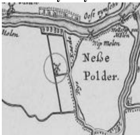
links van de Ryskade het poldertje de 'Kleine Nesse' met het molentje midden in de huidige buurt Keizershof

Rechts op de kaart staat de Nesselolder. Links daarvan ligt de Kleine Nesse. Daar staat een klein molentje ingetekend. Op andere kaarten is dit molentje niet te vinden, ook in het archief van het Hoogheemraadschap van Schieland is er niets over te vinden of beschreven, lang is dit een mysterie gebleven. Totdat er een notariële akte (17 september 1644) boven water kwam waarin dit kleine watermolentje wordt beschreven als privé bezit van Meijuffouw Halling (of Hallinx). Zij bezat het poldertje dat wordt beschreven als de "Kleine Nesse". Dit watermolentje maalde het overtollige water van haar land in de boezem van Ommoorden.