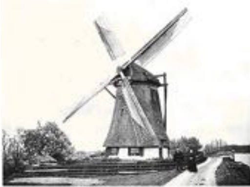
Een achtkantige watermolen

De "Ommoortsche Molen" was een achtkantige watermolen en al in de 16e eeuw bekend. In 1648 werd een nieuwe molen gebouwd op de fundering van de oude molen en was op 16 oktober van dat jaar gereed.