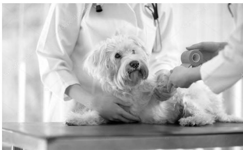
Fifi bij de dierenarts