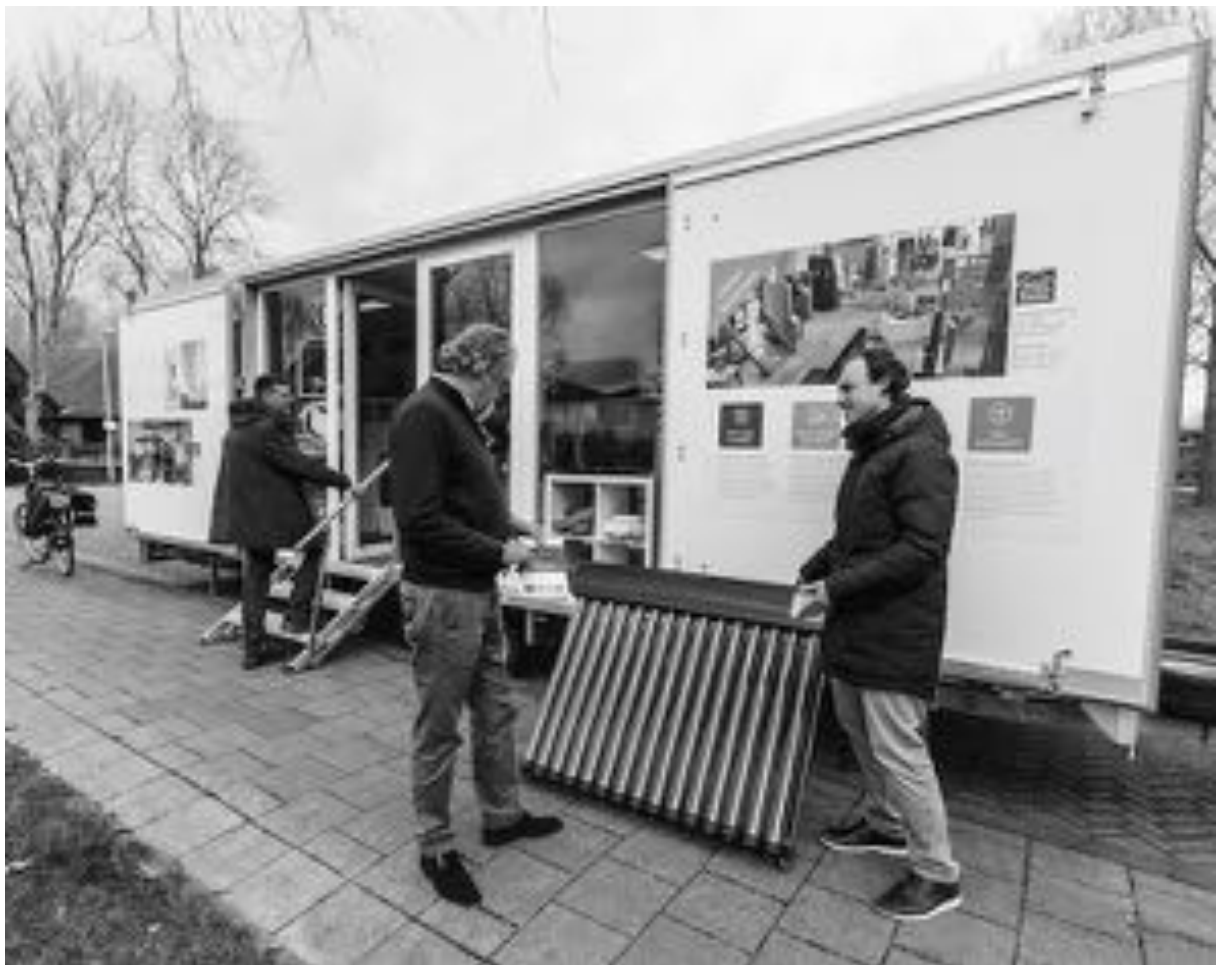
WoonWijzerWagen waar geïnteresseerde bewoners informatie kunnen krijgen over energiezuinig maken van de woning