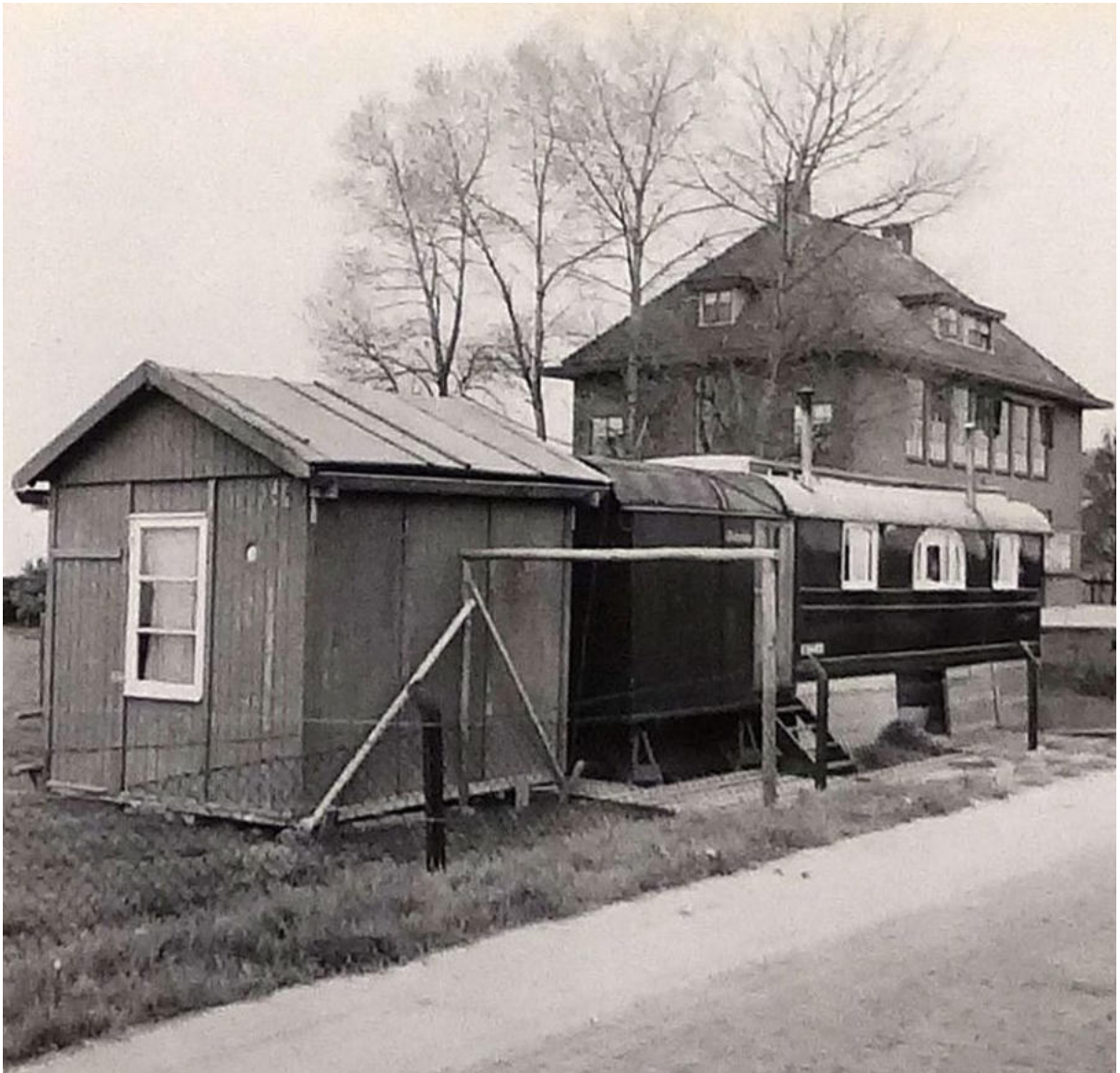
Woonwagen aan de Hoofdweg nabij het kruispunt met de Capelse weg.