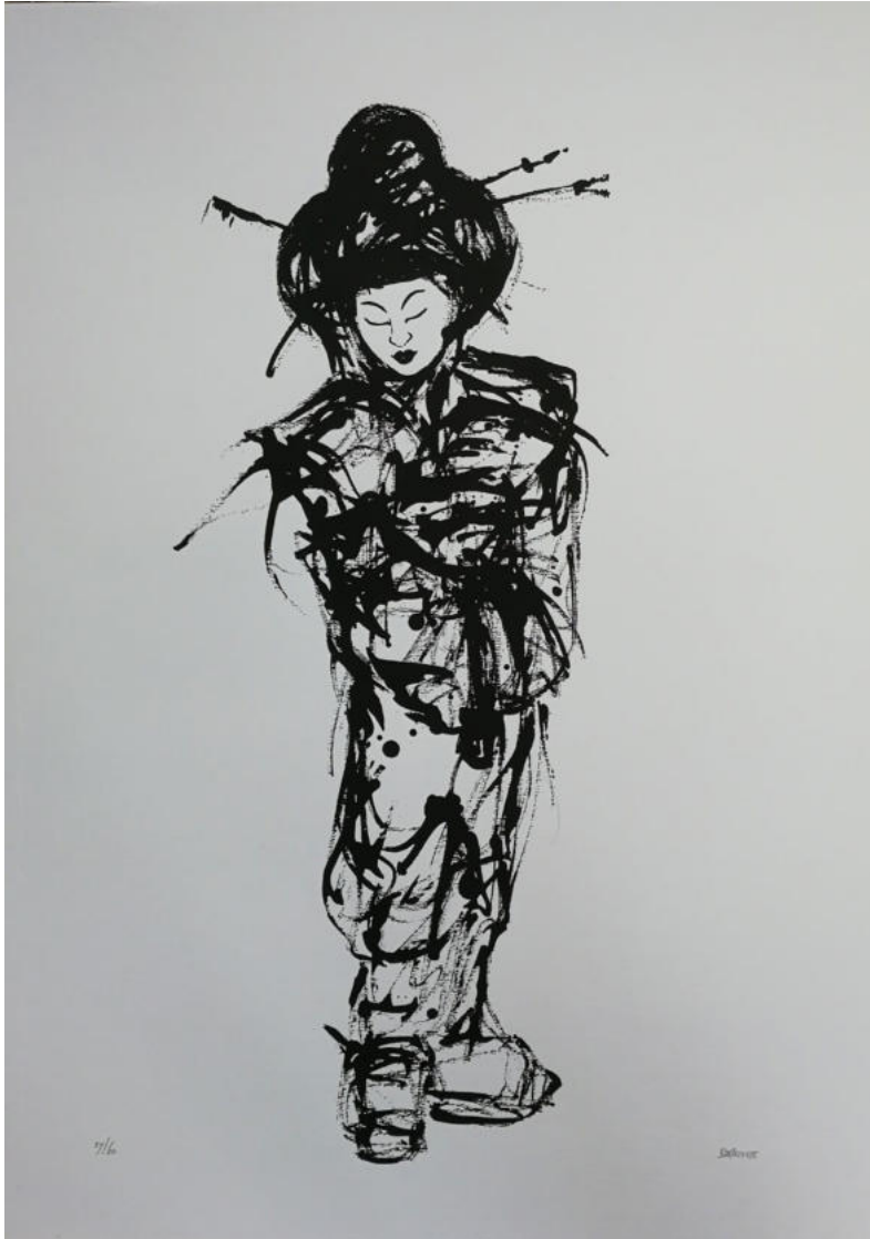
Kunstwerk van Joop van den Driesche.