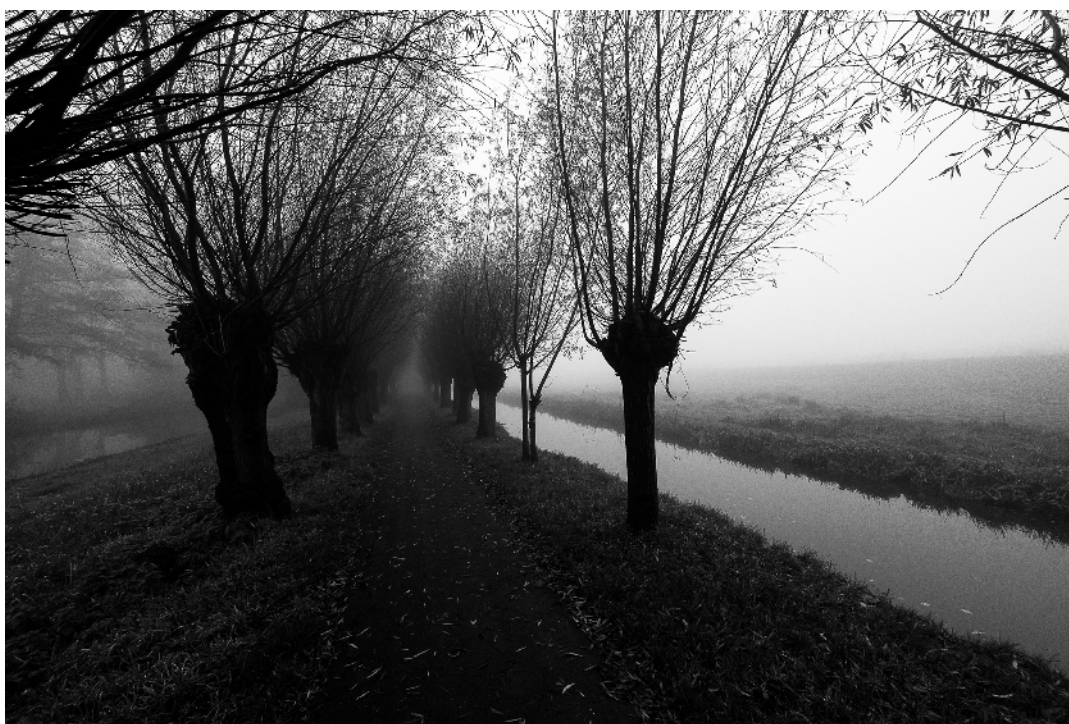
Werkgroep Ommoordse Veld Open & Groen

Vorig jaar meldden wij dat er ecologisch onderzoek plaats zou vinden naar wat mogelijk was in de weilanden ten westen van de Blijde Wei. Dat onderzoek spreekt van veel potentie om zeldzame planten als blauwgras terug te brengen.